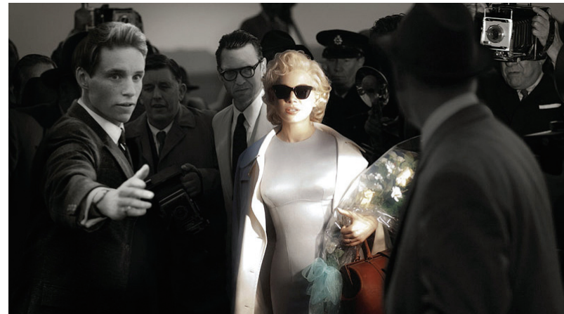
Odlična Michelle Williams in levo njen glavni soigralec, nadarjeni Eddie Redmayne